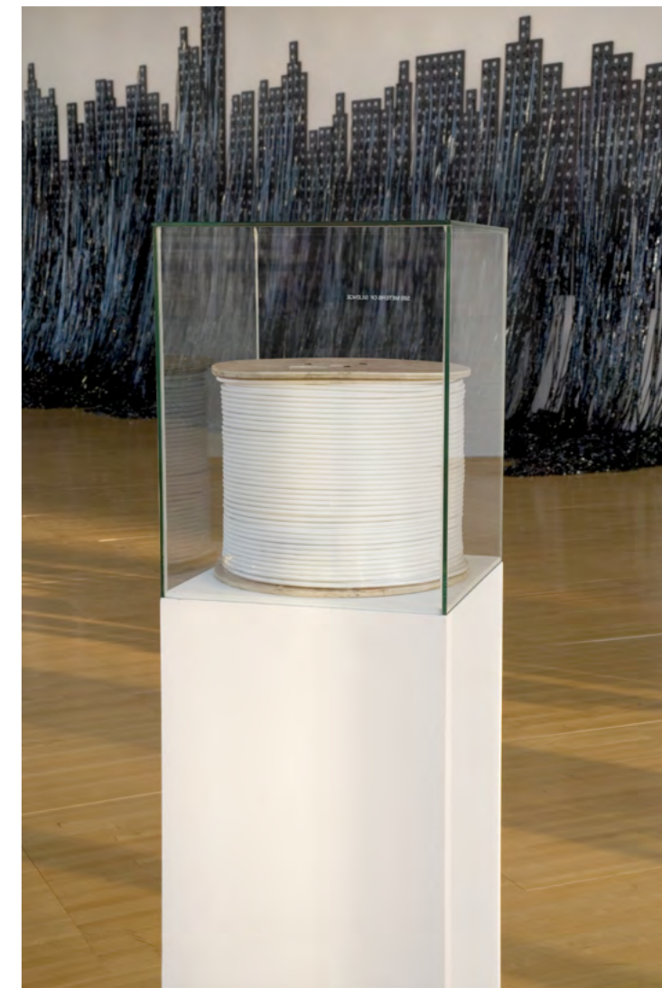
mounir fatmi 500 mètres de silence 2007 Câble d'antenne, bobine, Lettrage adhésif, socle, vitrine 137 x 47 x 47 cm © Adagp, Paris Photo : Jean-Baptiste Dorner

Son combat, qui lui a valu d'être censuré à plusieurs reprises, s'appuie également sur la production de vidéos et d'écrits : mounir fatmi a consacré plusieurs manifestes à des faits d'actualité, toujours en rapport, de près ou de loin, à des questions sociologiques ou anthropologiques.