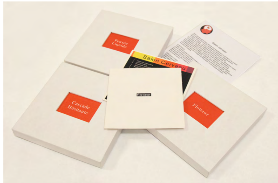
© Étienne Charry, Salon cerveau 2006 (Cascade hésitante, Flotteur, Pensée Liquide) 3 morceaux de musique choisis parmi la collection Salon cerveau

des pièces uniques, ont donné lieu à de nombreuses séances d'écoute dans des lieux d'art contemporain (Centre Pompidou, Galerie Agnès B). Il collabore fréquemment avec d'autres artistes, tels que le plasticien Pierrick Sorin et compose également pour la télévision.