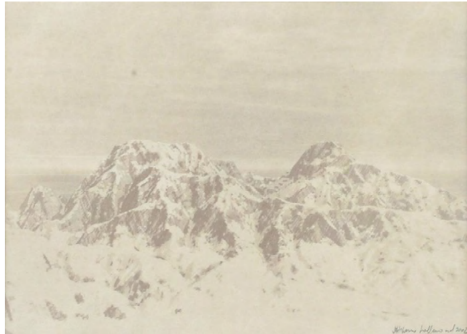
© Stéphane Lallemand Sans titre 2003 4 photographies Tirages photographiques albuminés, papier salé viré à l'or 16 x 22 cm, 16 x 26 cm, 17 x 48 cm, 17 x 46 cm

Stéphane Lallemand considère son travail comme une réflexion sur l'image et sur son caractère reproductible à l'ère du numérique. Il cherche à démontrer que si l'apparition de la photographie a transformé les représentations du réel, celui-ci peut désormais être reproduit sans l'usage d'un appareil. Grâce aux possibilités qu'offrent les nouvelles technologies, la copie se distingue en effet difficilement de l'original. Pour l'artiste, l'image est ainsi devenue une interface parmi d'autres, brouillant les frontières entre l'objet et sa représentation, entre le réel et la fiction.