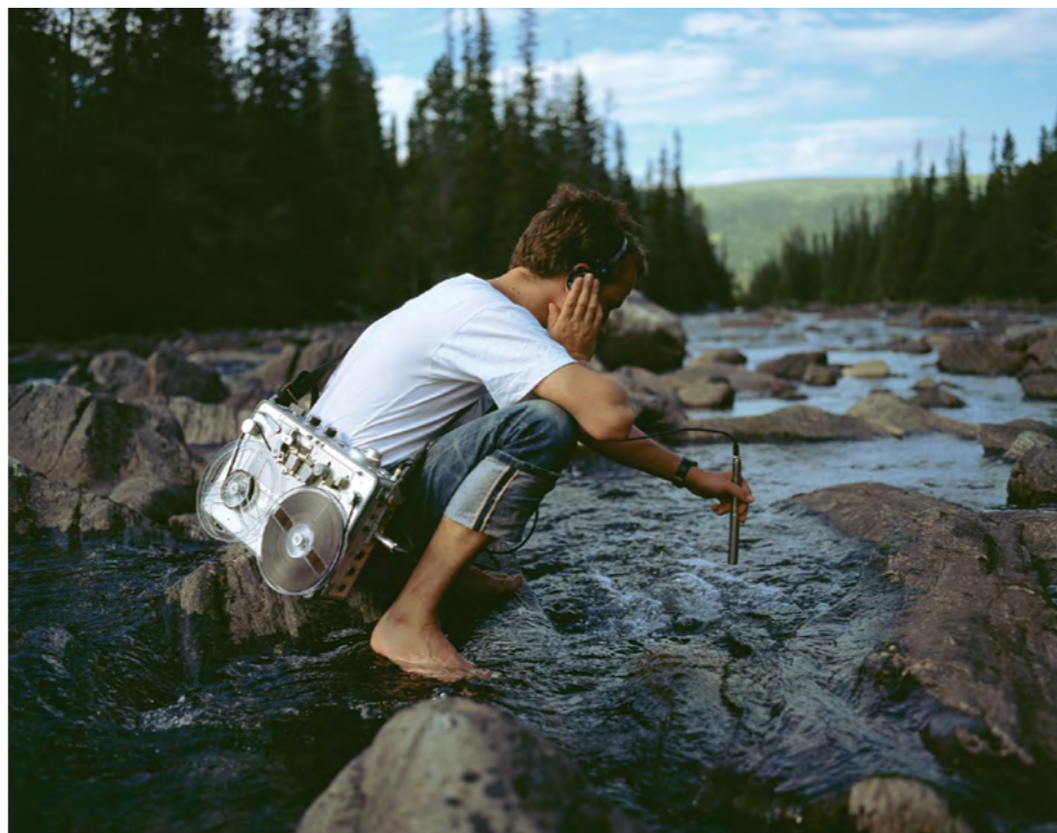
© Laurent Montaron The Stream 2007

travaux, le spectateur est souvent confronté à un espace-temps qui n'est pas présent dans l'œuvre elle-même mais qui peut être mental ou relever du souvenir. Connaisseur des techniques cinématographiques, l'artiste tente de comprendre de quelle manière les paradoxes issus des nouvelles technologies créent de nouvelles formes de conscience.