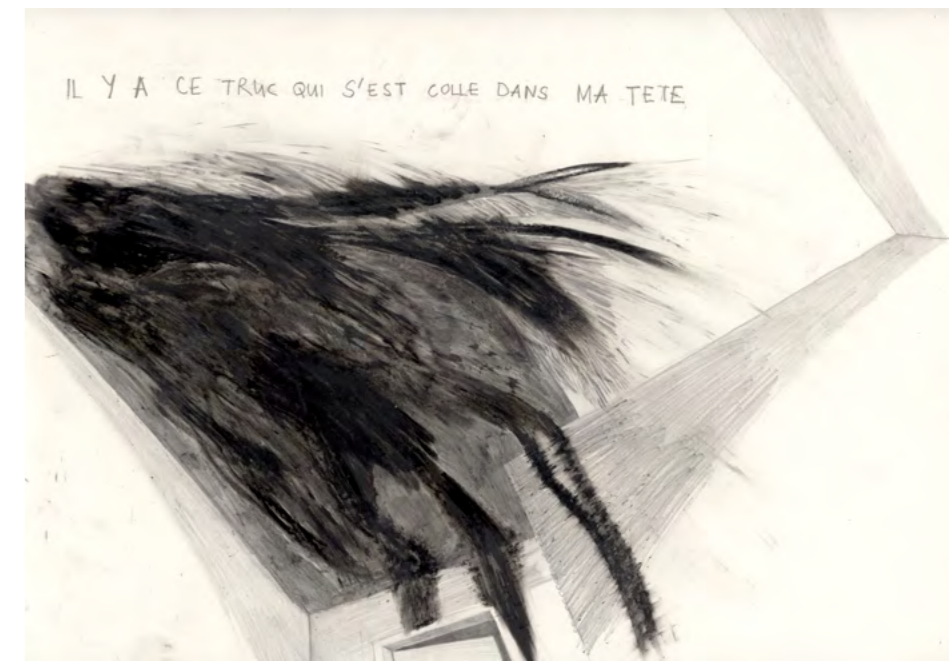
© Marc Bauer Dread 2006 Détail d'un ensemble de 10 dessins, Crayon gris et crayon noir sur papier, 10 x (32 x 45 cm)

En mettant à jour le processus de remémoration, l'artiste offre un travail orienté sur le souvenir, fragmentaire et imprécis, et confronte le spectateur à sa propre mémoire tout en ouvrant la voie à son imaginaire. Au cœur de son œuvre se situe la relation et le conflit entre la grande Histoire et l'histoire personnelle. Il s'appuie d'ailleurs à ce titre sur des photographies et des images de films ou de livres, dont il restitue un personnage, une composition ou une atmosphère dans ses dessins.