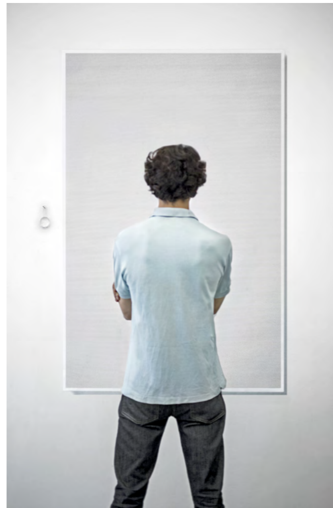
© Raphaël Denis Corps 1 : La Recherche du temps perdu 2011 Tirage pigmentaire sur papier Hahnemühle contrecollé sur Dibond, loupe 150 x 100 cm

Artiste pluridisciplinaire, il multiplie les médiums en recourant de manière récurrente aux modes opératoires de la citation et de la répétition.