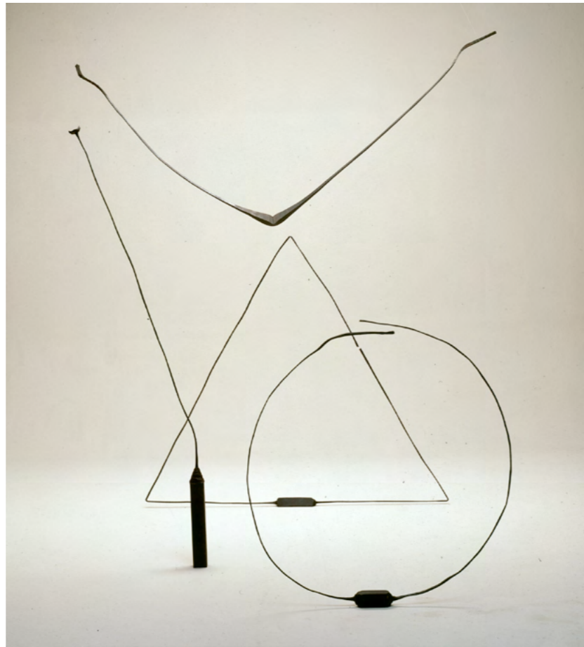
© Pierre Gaucher Sans titre 1986 Fer forgé Tige verticale hauteur : 170 cm, Pièce triangulaire : 137 x 120 cm, Pièce en V hauteur : 145 cm, écartement : 225 cm, Cercle : 90 cm de diamètre

de métal étirées et écrasées au marteau, ses sculptures se déploient dans l'espace à la manière d'une calligraphie à la fois tendue et souple. Depuis quelques années, son intérêt pour le langage donne lieu à la réalisation d'un travail d'écriture sur tôle. Comme un geste libérateur, Pierre Gaucher écrit ses pensées à même les plaques, afin de les inscrire définitivement et d'empêcher leur effacement.