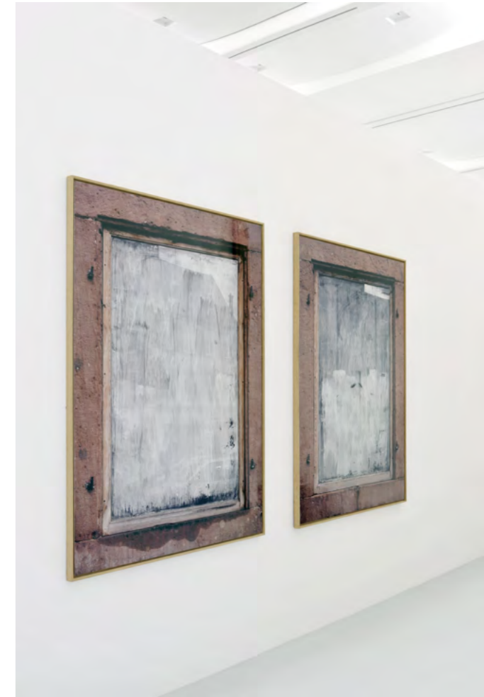
Philippe Gronon Vitrine n°1 et Vitrine n°2, Sélestat 2003 2 Photographies à l'échelle 1 de vitrines passées au blanc d'Espagne avec un encadrement en grès rose, prises Place d'Armes à Sélestat 2 x (178 x 131 cm) © Adagp, Paris Photo : Mathieu Bertola/Service photographique interne des musées de la Ville de Strasbourg

Philippe Gronon exploite l'image de manière chirurgicale ; il dissèque et analyse le monde dans ses tableaux d'objets. Perfectionniste, il tente d'affirmer le réel avec une planéité, une finesse et une précision qui régissent chaque parcelle de ses travaux. Délaissant la photographie traditionnelle au profit du hors-champ et de l'absence de point de fuite, l'artiste cherche à valoriser l'image pour ce qu'elle représente.