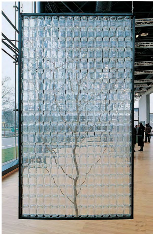
© François Yordamian TAXINOMIE 1987, L'arbre 1987 Installation Arbre, 285 bocaux, châssis métal, câbles, fil nylon 300 x 150 x 11 cm

en s'appropriant des fragments d'objets, d'images, de vidéos afin d'en proposer une étude méticuleuse. Il s'intéresse également aux comportements humains, aux actions et habitudes du quotidien, et en particulier aux conditions de visualisation des images.