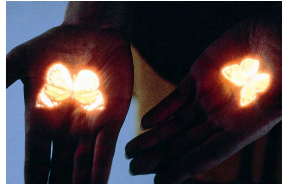
Bertrand Gadenne Les deux papillons 1988 Installation Projection d'une diapositive 300 x 100 x 100 cm © Adagp, Paris

tendue avec ses œuvres en donnant aux êtres filmés une véritable présence dans l'espace d'exposition. Les films et projections sont souvent réalisés en fonction de leur lieu de présentation. Les images oniriques de l'artiste évoluent dans un espace de pénombre à la manière d'hologrammes, éclairant la trace de leur passage d'un halo lumineux qui plonge le spectateur dans un univers où la vision et l'apparition finissent par se confondre.