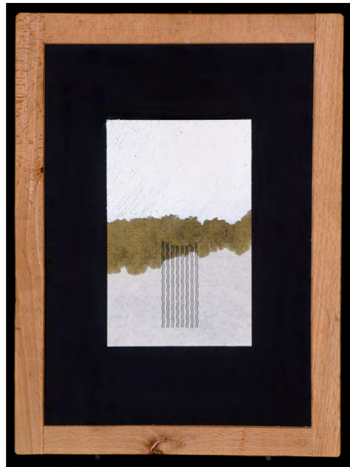
© Eleftherios Amilitos Détail de 3 projets de sculpture à ne jamais réaliser ou à ne pas faire, 1993 Letraset, huile et papier sur ardoise, 3 x (40 x 30 cm)

des espaces vides et pleins ainsi que de la profondeur de champ, pour créer des œuvres dont la plasticité évolue avec le regard du spectateur et les conditions d'exposition. Rompu aux formes neutres, organiques et abstraites, l'artiste crée à travers son art un nouveau langage de signes à déchiffrer.