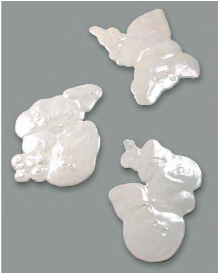
© Claire-Jeanne Jézéquel Splash 1, Splash 2, Splash 3 2004 Terre cuite émaillée et supports de type patins caoutchouc 54 x 41 cm, 64,5 x 62,5 cm, 59 x 47 cm, hauteurs variables n'excédant pas 5 cm

*(Extraits du site L'art dans les chapelles )