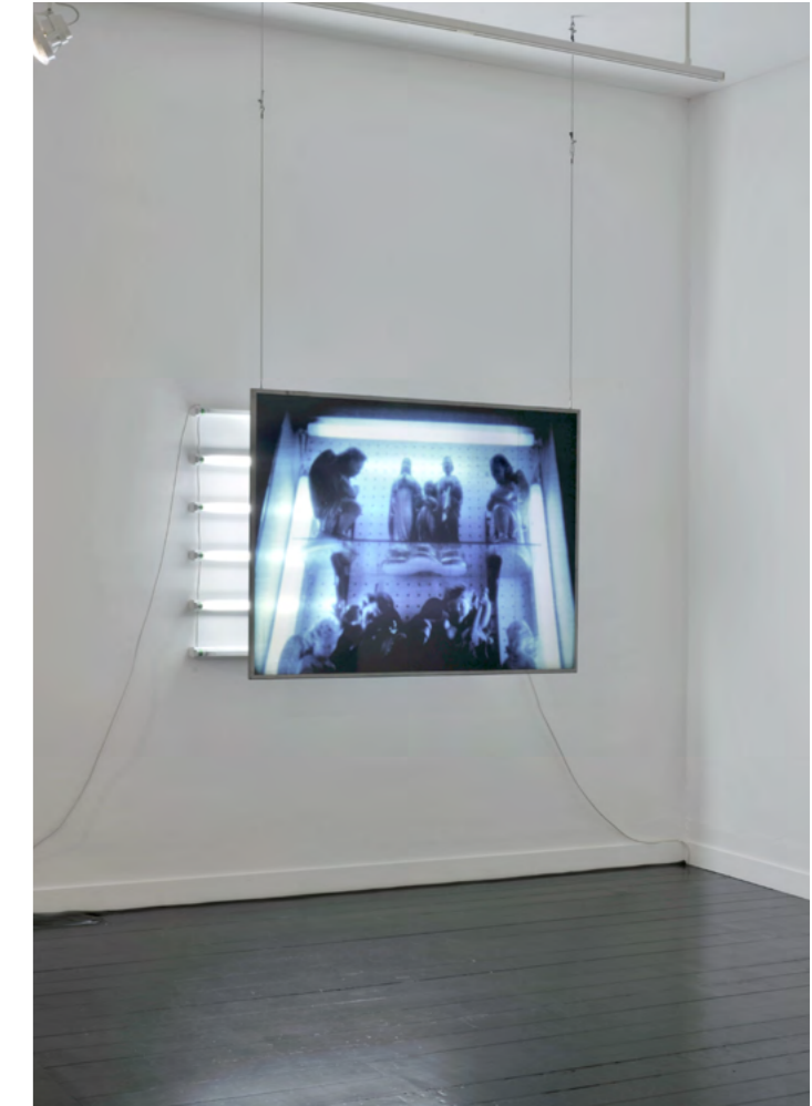
Clément Cogitore Ex-voto 2009 Installation photographique Tirage numérique, plaque de verre, 6 tubes fluorescents, Tirage numérique : 110 x 130 cm

Clément Cogitore développe un travail à la croisée du cinéma et de l'art contemporain qui vient questionner le rapport des hommes aux images et aux récits collectifs. Parvenant à créer de nouveaux récits à travers ses œuvres en associant le réel et la fiction, l'artiste se plaît à les confondre afin d'instaurer de nouvelles clés de lecture.