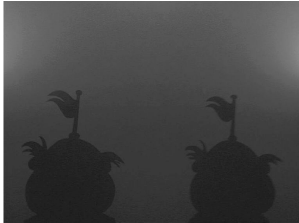
© Maïder Fortuné Curtain ! 2007 Projection vidéo sonore (4/3) Durée : 17min

mise en scène. Vidéoprojection, encadrement, diffusion sur petit moniteur ou sur écran plasma, l'artiste capture l'image inspirée des techniques cinématographiques. Son travail porte l'empreinte et l'interrogation du souvenir et de l'absence, qu'elle utilise également dans de nombreuses œuvres-citations. Mobilisé par la notion d'instant précis, le travail de Maïder Fortuné marque une pause poétique pour le spectateur dans un univers à la fois fantastique et fantasmagorique.